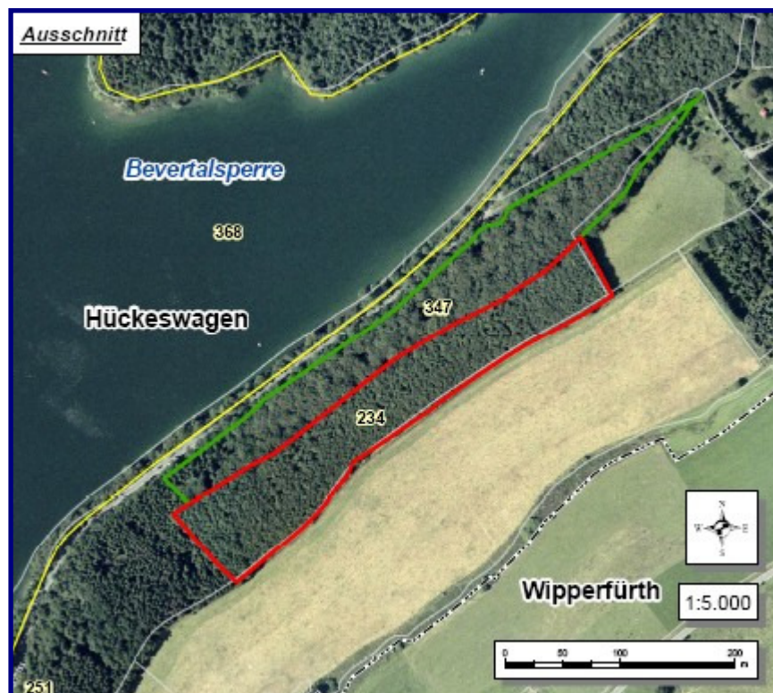
Abb. 2: Digitale Orthophotos im Maßstab 1:5.000 (DOP5)

Zum Verkauf stehen zwei benachbarte forstwirtschaftliche Flächen in Hückeswagen im Oberbergischen Kreis. Die Flächen befinden sich im Ortsteil Niederlangenberg. Aus Gründen der Bewirtschaftung stellen die beiden Flurstücke eine wirtschaftliche Einheit dar und stehen daher zusammen zum Verkauf.